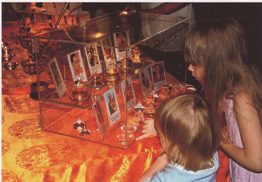
Utställningarna lockade många besökare i alla åldrar. Montern på bilden innehåller relikver av mästare från vår tid.