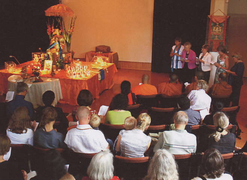
Vid invigningsceremonin på Etnografiska museet reciteras Hjärtsutran och ett antal böner på svenska.